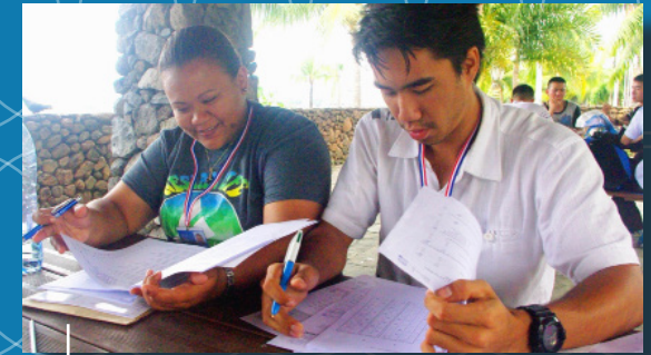
Enquête SMPG à Tahiti